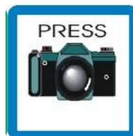
NOVINAR - FOTOGRAF